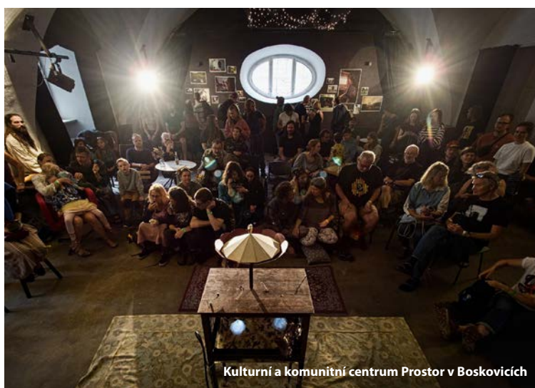
Kulturní a komunitní centrum Prostor v Boskovících

Vlastní scénu v Kaštanu provozujeme už od roku 2004 a v roce 2025 se podařilo realizovat více než 230 akcí (z toho cca 50 pro děti): koncerty a festivaly, divadelní představení, výstavy, přednášky, besedy, čtení a workshopy. V hlavním sále v prvním patře objektu nebo open-air v pleneru je navštívilo více než 12000 diváků. Z větších akcí můžeme jmenovat např. festival příznivců Boba Dylana – 24. Dylan Days, festivaly a setkání Osamělých písničkářů, 5. ročník festivalu hudby, o které se píše v kulturním magazínu UNI – UNIfest, 20. ročník akce Free Jazz Festival, další ročník benefičního koncertu sólistů a skupin z řad pracovníků Kaštanu – Vyloupenutej Kaštan či sérii adventních pořadů a speciální adventní programy pro děti a dospělé vč. rozsvěcení vánočního stromu. V roce 2025 se zde dále mimo večerní program pravidelně konaly např. zkoušky Divadla Psycheche, které propojuje svět zdravých a duševně handicapovaných herců a jehož představení bylo také součástí programu.