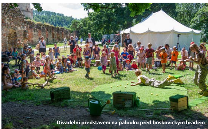
Divadelní představení na palouku před boskovickým hradem

Součástí programu byly speciální site specific projekty realizované zejména v židovské čtvrti: divadelní projekt se zapojením místních studentů, performativní audiowalk a výtvarné instalace v ulicích židovské čtvrti mezi nimiž je i v Boskovicích dlouhodobě umístěná velkoformátová plastika Patrika Proška Ježek v kleci, která je součástí rozsáhlejšího projektu