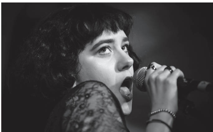
Žižkovská noc v Čítárně, skupina Interrupted

Máme za sebou další Žižkovskou noc a byla to zase síla. Na pódiu se vystřídala řada mladých i zavedených kapel, mj. Dunaj, Znouzectnost i Prouza a oba večery měly úžasnou atmosféru. Slovy kapely Znouzectnost: „Bývají hektický večery, kdy určitý neřešitelný organizační diskomfort (pokud má akce v nějaké podobě proběhnout) vyvažuje