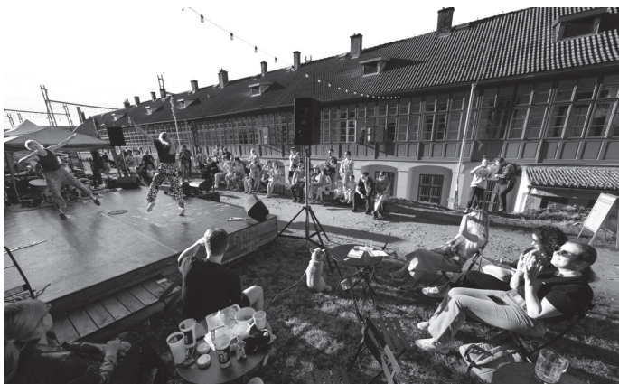
21. 9. opět ožila celá Krenovka se Zažit město jinak

Ptáci už se šikují k odletu, děti sedí už dost odevzdaně v lavicích... a jak vypadá podzim u nás v Čítárně? U nás si můžete vybrat z pestré palety, co bude nejlépe pasovat právě vám. Ať už máte chuť přijít se k nám jen ohřát do útulného pokojíčku s teplou kávou, nebo se pořádně probudit a třeba i roztančit na energických koncertech Fumar Mata společně s Caulichute či načerpat tu správně nostalgickou náladu na besedě Radio 1 nablízko s Ondřejem Štindlem nebo na vzpomínkovém večeru věnovaném Petru Skoumalovi. Kdo má rád filmy, může přijít oslavit 10 let s KineDokem a jejich péčí o dokumentární film. Všechny možnosti jsou správně. I nabídka baru potěší bez ohledu na nevyzpytatelnost počasí, ať už se potřebujete ohřát, nebo zchladit.