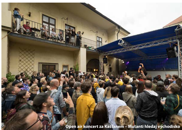
Open air koncert za Kaštanem – Mutanti hledaj východiško

Vlastní scénu v Kaštanu provozujeme už od roku 2004 a v roce 2023 se podařilo realizovat přes 300 akcí nejen pro dospělé: koncertů, divadelních představení, výstav, přednášek, besed, čtení a workshopů. V hlavním sále v prvním patře objektu, v komorní kavárně Únik nebo v open-air v pleneru je navštívilo takřka 12000 diváků. Z větších akcí můžeme jmenovat fes-