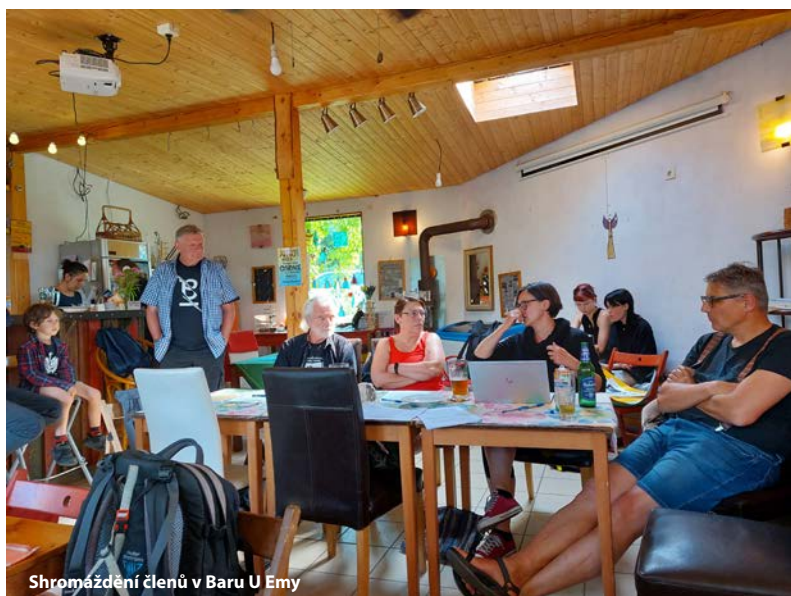
Shromáždění členů v Baru U Emy

Jednou za rok svoláváme Shromáždění členů spolku Unijazz (dle stanov „nejvyšší výkonný orgán spolku“), během kterého spojujeme schválení Výroční zprávy včetně hospodaření za předchozí rok a informování členů o chodu spolku s neformálním setkáním a kulturním programem, nejčastěji v rámci aktivity některého ze členů našeho spolku. V roce 2023 proběhlo řádné Shromáždění členů 10. června v Baru U Emy ve Lhotce-Svinaře. Přítomní členové zhodnotili rok 2022