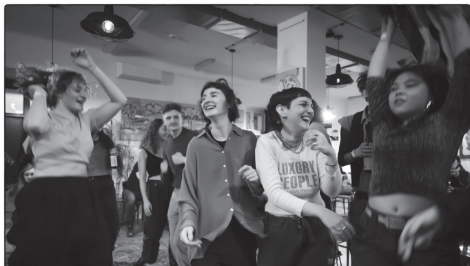
Žižkovská noc v Čítárně

Minulý měsíc jsme tu měli nudu.... Haha... apríl! Máme akorát za sebou Žižkovskou noc a musíme uznat, že to byl letos opět neuvěřitelně vydařený, úžasný zážitek!