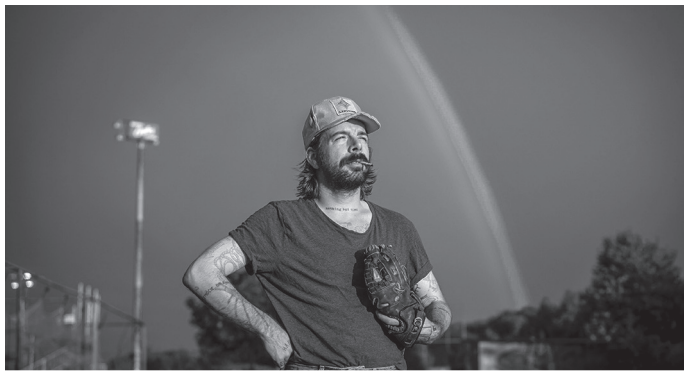
Lazer Viking vystoupí letos v Boskovicích

A co nás tentokrát v Boskovicích kromě spousty skvělé muziky, divadelních představení pro dospělé i děti, filmů všech možných žánrů, inspirativních setkání s autory výtvarných projektů, přednášek či autorských čtení čeká? Tak například pro vás chystáme debaty